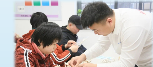
中建港航局“建证未来·蓝鲸灵”青年志愿服务“阳光家园”温暖行动

素材来源:基础部(中建基础),中建国际,中建一局、二局、三局、四局、五局、六局、七局、八局,中建新疆建工,中建设计研究院,中建东北院(东北区域总部),中建西北院,中建西南院(西南区域总部),中建西勘院,中建上海院,中建市政西北院,中建阿尔及利亚公司,中建南洋公司,中建中东公司,中建发展,中建科创集团,中建方程,中建交通,中建装饰,中建科工,中建安装,中建西部建设,中建港航局,中建科技,中建数科,中建丝路(西北区域总部),中建资本,中建财务公司,中建党校(中建管理学院),中建产研院(中建技术中心)