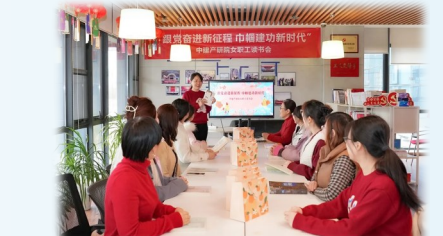
中建产研院组织女职工开展读书会活动,引导女职工通过阅读研讨涵养文明之风,擦亮巾帼底色。