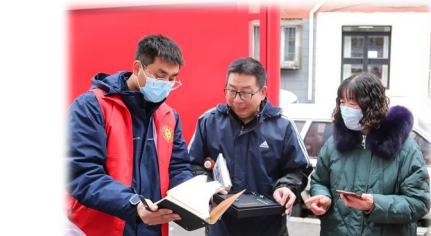
中建东北院(东北区域总部)广泛开展爱心义卖志愿服务活动,让“奉献、友爱、互助、进步”的志愿者精神深入人心。

中建产研院组织女职工开展读书会活动,邀请职工代表推荐经典书目,引导女职工围绕女性成长、励志奋斗、文明有礼、家风培育等方面分享阅读心得。通过阅读研讨涵养文明之风,擦亮巾帼底色,让大家在阅读中增长智慧、传承文化、享受阅读乐趣,树立文明有礼良好风尚。