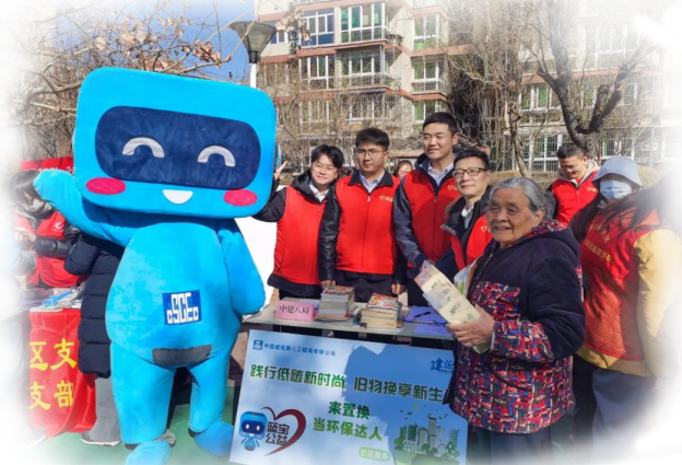
中建八局华北公司围绕中建集团文化深化“133”工作体系,广泛开展知识竞赛、实地研学、志愿服务、工友共学等活动。

在中国建筑“文明有礼月”,集团各子企业围绕文明有礼宣贯、回应相关方期望、提升职业素养、规范网络言行、深植廉洁文化、落实安全文化、践行合规文化、选树中建榜样、党建带团建带工建等重点工作,开展系列活动,旨在引领中建集团广大党员干部职工深入践行《中建信条》《十典九章》,在工作生活中做到文明守礼、言行有节。