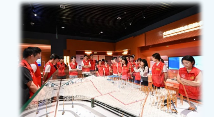
中建科工华南大区与深圳市坪山区新时代文明实践中心开展共建,共同推动新时代精神文明建设高质量发展。