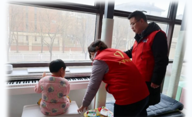
中建方程志愿者连续七年陪伴见证着北京“爱百福”视障人士关爱中心的盲童们快乐成长。