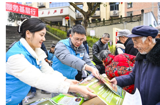
中建二局西南公司实业公司联合属地重庆市江津区林业局开展“携手构建共生之美”关爱保护野生动植物主题公益活动,向市民朋友宣传保护野生动植物知识。(曾蓉)