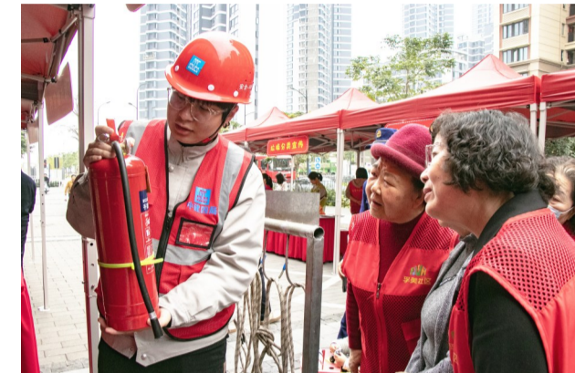
中建四局建设发展公司厦门海沧祥露小区项目、马垄湾保障房地社区二期项目联合属地社区、消防支队开展消防安全科普志愿服务,向社区居民普及消防安全知识,讲解并实操消防器材使用方法。(石哲吾、黄畅)