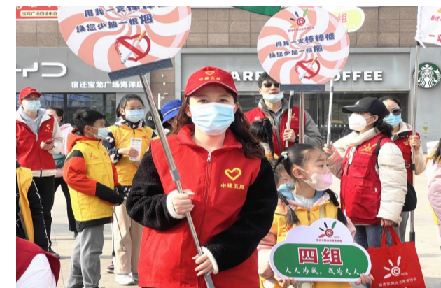
中建五局华东建设宿迁片区项目联动阳光志愿者协会开展“学雷锋·棒棒糖换烟”公益活动,宣传科学戒烟,倡导健康生活方式,在参加活动的小朋友心底种下一颗文明、健康的种子。(易梦婷)