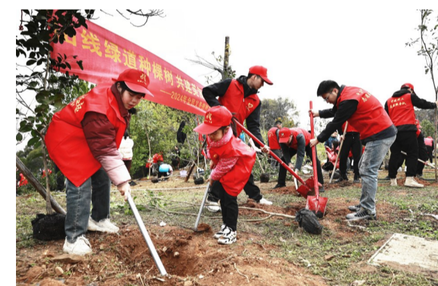
中建科技福建公司泉州片区项目志愿服务队开展“春‘锋’十里添新绿”植树公益行动,志愿者们身穿红马甲、干劲十足,种下一棵棵桂花树,为美丽家园再添新绿。(龚绵强)