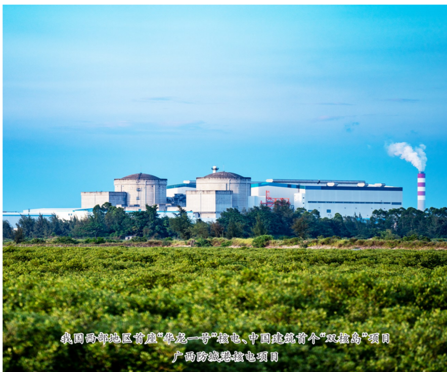
我国西部地区首座“华龙一号”核电、中国建筑首个“双核岛”项目 广西防城港核电项目

中建二局立足“人与自然和谐共生”谋划发展,优化科技研发布局,搭建博士后工作站,建立战略研究、工程研究、设计管理研究“双碳”工作研究体系;成立中国建筑基础设施技术与装备工程研究中心(核电工程),全面开展盘查工作,围绕水环境治理、烟气治理、土壤修复、近海光伏等领域加大核心技术攻关力度,形成百余项国际先进技术成果。主持或参与多项国家及行业近零能耗建筑、零碳建筑等标准规范制定,主编国标《建筑施工过程碳排放应用技术图示》,完成我国第一部针对装配式建筑施工阶段碳排放计算的团体标准《工业化建筑施工阶段碳排放计算标准》;成功建设近零能耗住宅