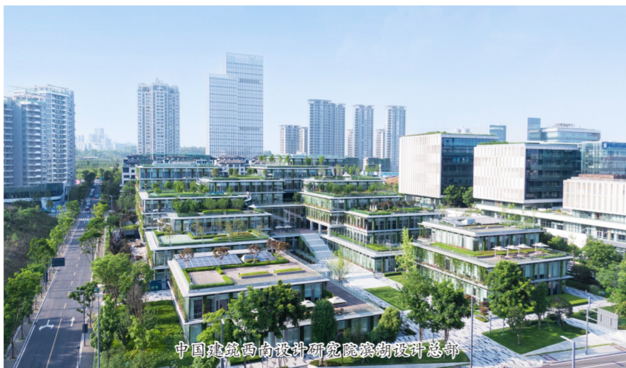
中国建筑西南设计研究院滨湖设计总部

前不久,广东省深圳市龙华区樟坑径“华章新筑”迎来了首批住户。不少业主在现场感叹:“这房子像汽车一样,是在流水线上建出来的。”该项目首次应用中建海龙科技有限公司研发的高层建筑混凝土模块建筑体系,将5栋99.7米高的建筑拆分为6028个独立模块单元,每个模块单元内的结构、机电、装饰装修等大部分工序都可以在工厂内预制,最后现场施工形成完整建筑。数字化贯穿项目设计、生产、运输、现场施工安装等全过程,实现了建筑工业化和智能建造的有效融合。