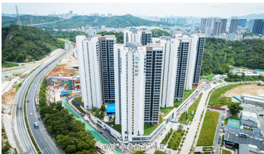
深圳“华章新筑”项目

同时,中建海龙科技还运用绿色建造技术,使项目在废弃物、材料损耗、碳排放、能耗、水耗等指标上取得低碳环保成效。与传统建造方式相比,该项目建造阶段减少碳排放约4190吨。