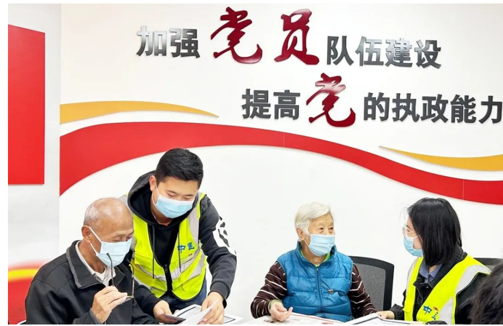
中建五局以联建联学凝聚合力促发展,推动党建和业务深度融合。中建五局三公司天津分公司地铁7号线一期工程6标项目党支部开展“邻里课堂”,与周边党建共建社区——卫华里社区共同学习党的二十大精神。