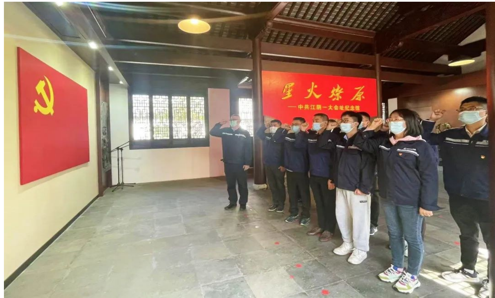
中建发展基层党组织迅速行动,精心组织,通过“三会一课”、党建联建、主题党日等形式,持续兴起学习宣传贯彻党的二十大精神热潮。江苏江阴项目联合党支部党员前往中共江阴一大纪念馆开展主题党日活动,通过实地研学深刻领会党的二十大精神。