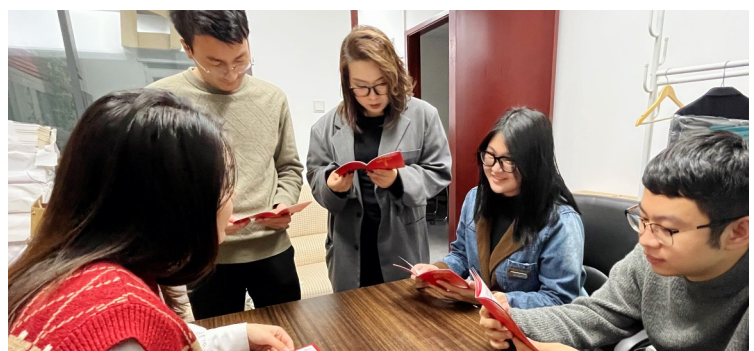
中建交通铁路公司制作党的二十大精神应知应会知识口袋书,内容涵盖党的二十大精神学习手册、学习金句等,引导广大党员、职工群众深入学习领会、学用贯通。