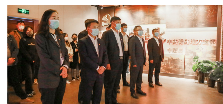
中建港航局以学促思,引导项目一线学习宣传贯彻党的二十大精神走深走实。局党委巡察组临时党支部与筑港公司总部第四党支部走进中共青岛党史纪念馆,开展“学习二十大 建证四十年 奋进新征程”联学共建。