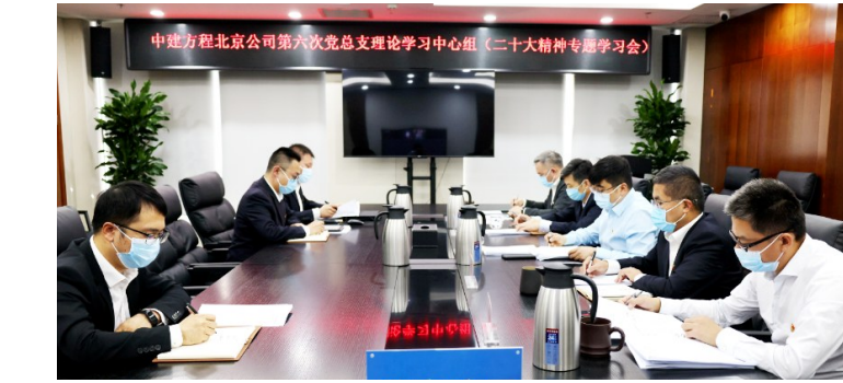
中建方建基层党支部线上线下学习党的二十大精神,支部书记带头学,党员干部全面学,并充分发挥党建引领带动作用,所属北京公司总部第二党支部整理分享党的二十大精神关键词。