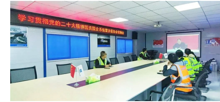
中建西南院项目党支部以多种形式持续推动基层深入学习党的二十大精神。及时传达深入学,原文线上随时学,丰富载体生动学,推动学习成效转化为创建世界一流企业的不竭动力。