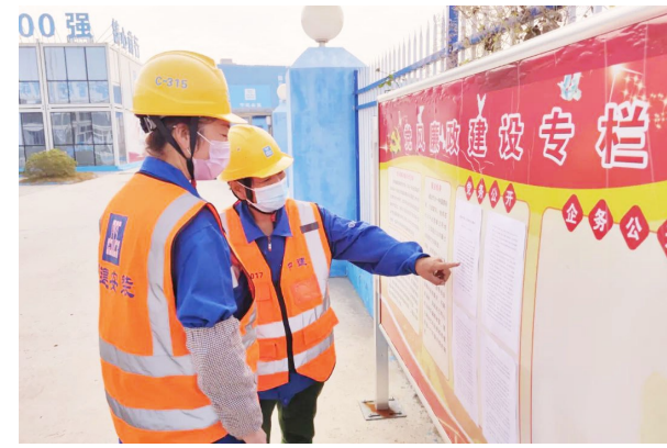
中建安装南京公司、中建五洲、投资公司印制图文并茂的“党的二十大精神金句摘要”,张贴在项目宣传栏,让工友们看得懂、能领会。