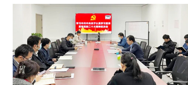
中建研究院结合实际创新举措,领导班子走进中建万地极多功能试验系统研发团队,围绕“健全科技创新举国体制”谈学习感悟、谋发展方向,引导全体职工以更加昂扬的斗志、更加务实的作风推动企业高质量发展。