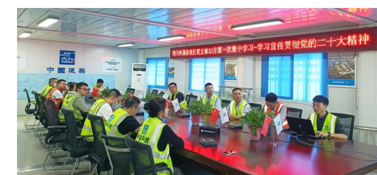
中建科技西部公司及所属四川外国语大学重庆科学城学校项目党支部开展党员(扩大)会议,组织开展“学习二十大、永远跟党走、奋进新征程”主题文艺作品比赛,营造良好学习氛围。