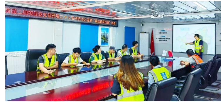
中建七局南方公司广西南宁西园二期项目组织开展“学习二十大 讲述我的建筑足迹”活动,项目职工轮流讲述近十年来的从业经历以及祖国日新月异的变化,以切身经历感悟中国新时代取得的非凡成就。