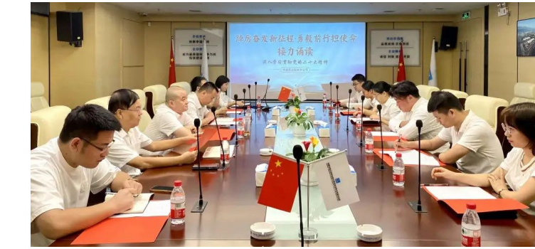
中建市政西北院南方公司党支部通过专题学习、接力诵读、“银青对话”等形式,实现党员干部、团员青年和职工群众学习党的二十大精神全覆盖。