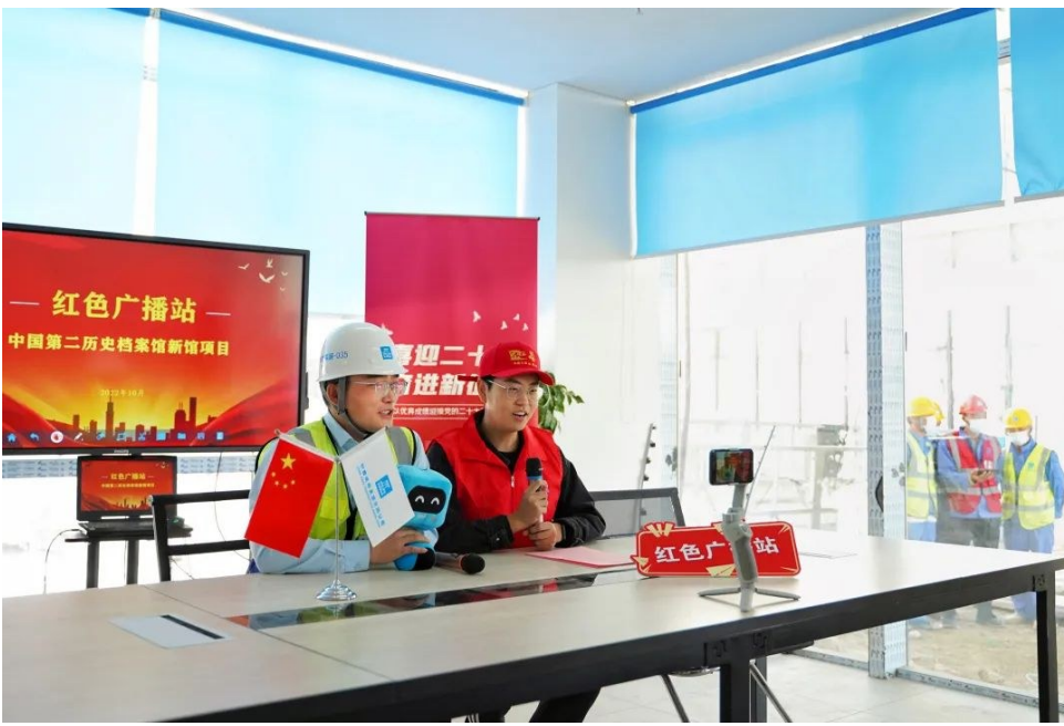
中建装饰中国第二历史档案馆新馆项目成立红色广播站,通过广播宣传党的二十大精神,借助“爱心班车”上的流动“讲台”,智慧展厅里的定点党课、录制“指尖课堂”微党课视频等,引导工友学习领会党的二十大精神。