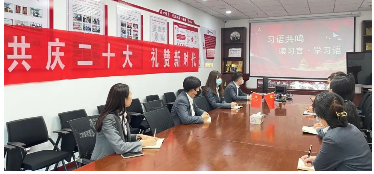
中海物业各项目通过“党工团”联动,组织党员干部群众深入学习党的二十大精神。西安中海棠御华府作为“红色物业”标杆项目,管理处党员干部研读党的二十大精神,感悟思想伟力,畅谈学习心得。

中建集团党组深入贯彻党中央关于学习宣传贯彻党的二十大精神决策部署,认真落实国务院国资委工作要求,系统传达学习大会精神,全面部署学习宣传和贯彻落实工作,第一时间召开传达学习贯彻党的二十大精神动员大会,制定《中共中建集团党组关于在全集团认真学习宣传贯彻党的二十大精神的决定》,要求全集团把学习宣传贯彻党的二十大精神作为当前和今后一个时期的首要政治任务,切实增强责任感使命感,学深悟透党的二十大精神,强化思想引领,强化担当作为,强化工作落实,迅速兴起学习宣传贯彻的热潮。