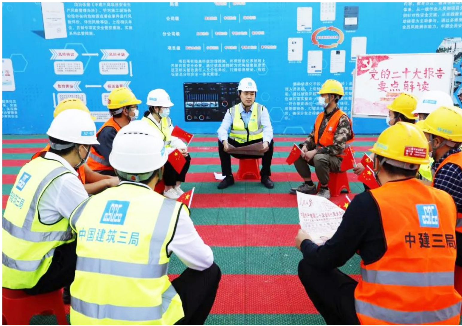
中建三局紧密联系广大党员干部群众思想和工作实际,开展多层次宣讲。中建三局总承包公司安装分公司组建“小板凳”宣讲队,党的二十大代表、青年员工首当其冲担任宣讲员,与项目员工、工友一同学习党的二十大精神,并结合自身工作经历和岗位实际交流学习心得。