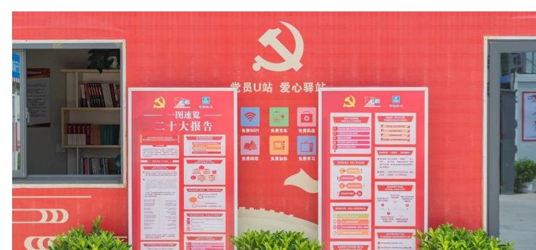
中建科工佛山医院项目党支部注重一线工友学习,打造“流动讲堂”,通过制作“学习党的二十大精神”口袋书、在党员口站设置党的二十大精神图展展架、设计施工现场金句标语等形式,提升工友学习热情。