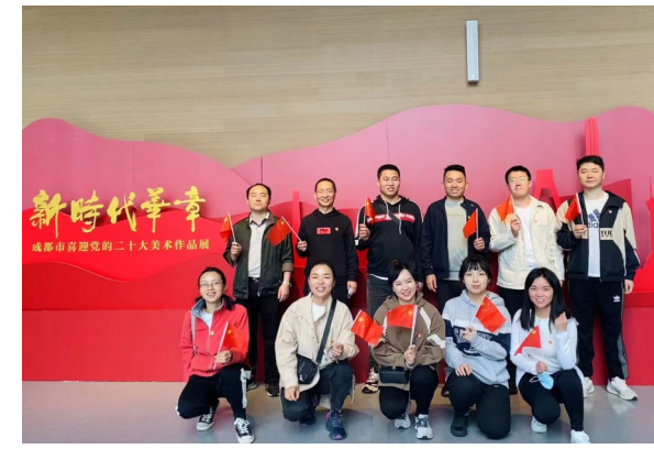
中建长江(西南区域总部)总部第二党支部组织全体党员、入党积极分子参观“新时代华章”美术作品展,体悟非凡十年的伟大成就。