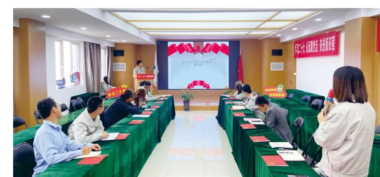
中建西部建设各党支部通过读书会、主题党日等方式深入学习党的二十大精神。组织党员干部职工结合学习习近平总书记关于国有企业改革发展和党的建设的重要论述,并联系自身岗位、公司发展开展专题研讨。