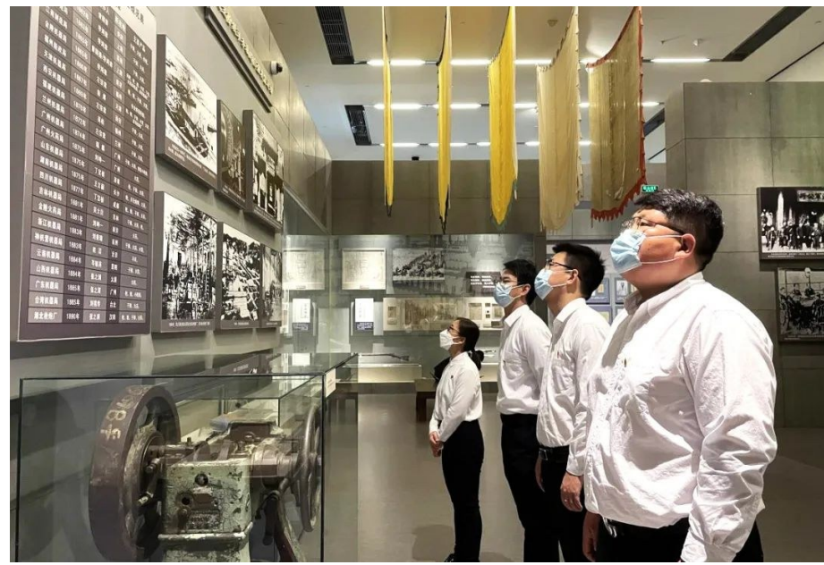
中建国际通过追寻红色足迹实地研学,深刻领会党的二十大精神。所属中建-大成公司小瓦窑产业园项目党支部组织开展“学习二十大 奋进新征程 书写新篇章”主题党日活动,赴国家博物馆沉浸式学习伟大建党精神,忆初心、颂党恩、跟党走。