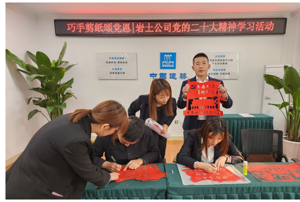
中建东北院岩土公司职能党支部开展“巧手剪纸颂党恩”活动,通过“剪纸学金句”,将党的二十大精神别进党员职工心里。