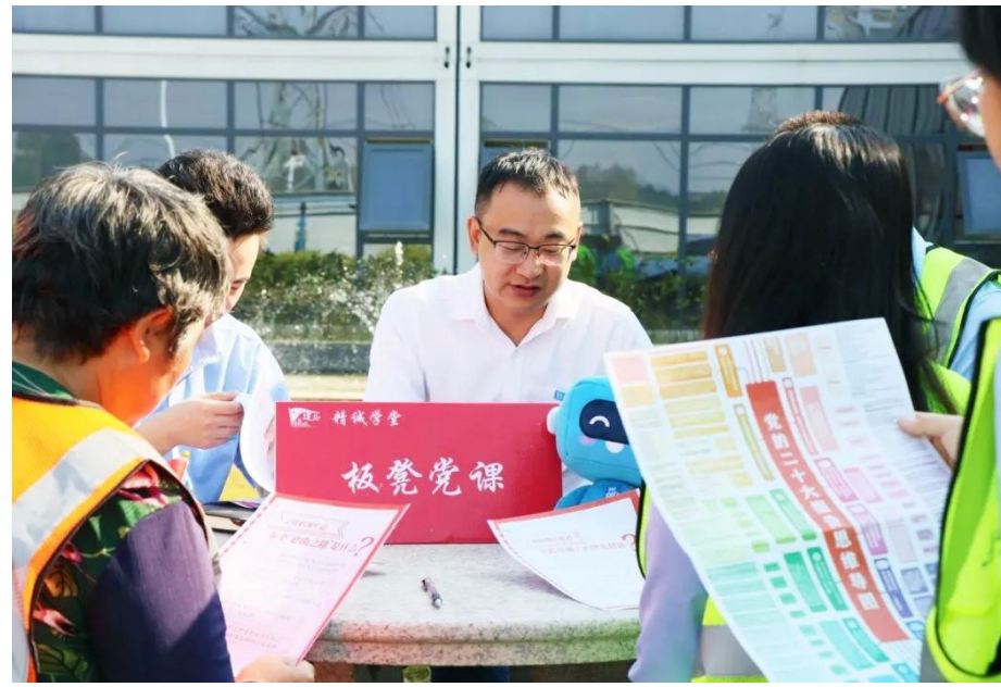
中建四局华南公司组建“8090宣讲团”,把“板党党课”搬到广州科教城项目建设一线,带动广大党员干部群众共同学习党的二十大精神。