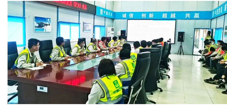
中建新疆建工以学促行,推动学习宣传贯彻党的二十大精神走深走实。基层党支部围绕学习党的二十大精神,认真学习新时代党的建设总要求,切实把党的二十大精神各项部署要求落实到企业改革发展各领域各方面。