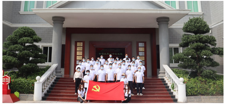
基础部(中建基础)各项目部通过与共建单位实地联学,共同学习党的二十大精神。深惠城际2标项目(联合)党支部联合深圳市龙岗区团委、深圳铁路投资建设集团等单位,组织开展“学习二十大”主题党日。