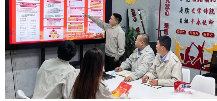
中建二局华北公司通州棚改项目党支部一手抓力度,一手抓深度,开设集体大课堂,领导干部带头学原文、谈感悟,以“三会一课”形式开展学习,组织集体研讨。

集团各级党组织贯彻落实《决定》要求,推动党的二十大精神进项目,精心精心组织全体党员干部原原本本、原汁原味学习党的二十大精神,结合项目实际,带着问题学,深刻把握党的二十大精神重大意义、精神实质、核心要义和实践要求,切实做到学深悟透、融会贯通,确保党的二十大精神横向到边、纵向到底,教育引导集团党员干部、团员青年和职工群众切实把党的二十大精神新要求落实到企业改革发展各领域各方面,以优异的发展成绩展现学习宣传贯彻党的二十大精神的实际成效。