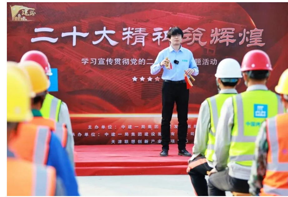
中建一局创新学习方式,坚持分层分类,注重生动形象,用职工群众听得进、记得住的方式宣传大会精神。天津联想创新产业园项目将党的二十大精神要点编成朗朗上口的快板书,组织工友学习党的二十大精神。