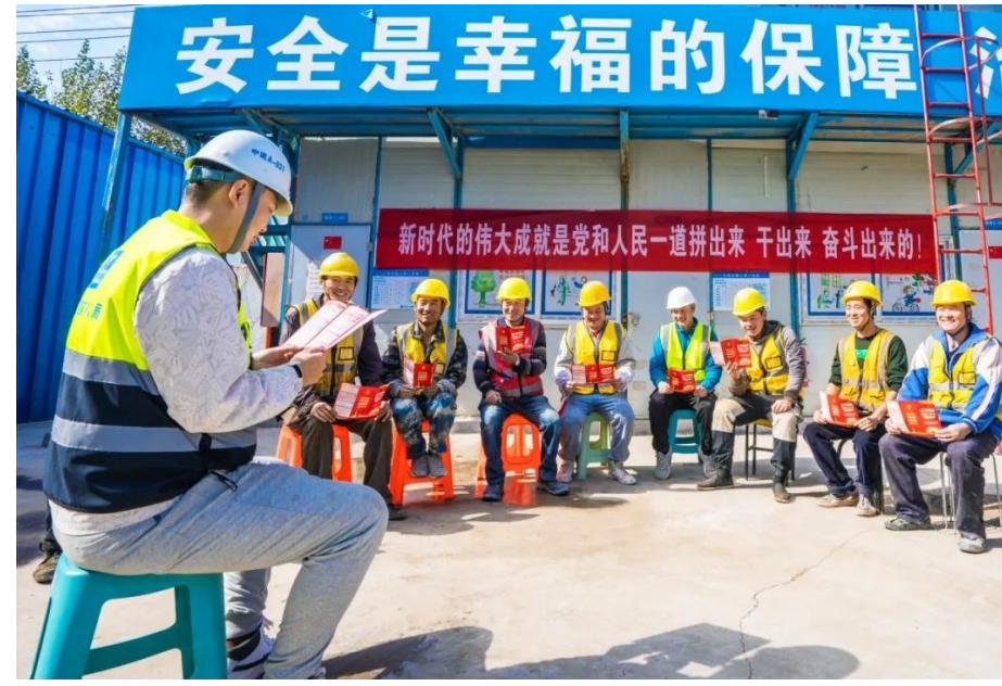
中建八局康乐大学项目党支部结合线上线下学,通过“学习强国”平台、手机报、党员微信群等组织线上学习,并在项目部贴海报、展展板,线下持续学习党的二十大精神。