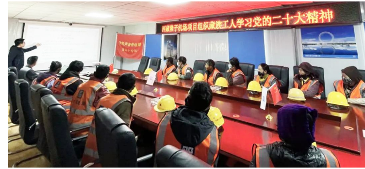
中建六局第一时间将党的二十大精神“送”进项目一线。广州大学黄埔研究院项目、西咸机场项目党支部成立“党的二十大精神宣讲小分队”,深入施工现场,用项目工友听得懂、能领会的语言宣讲党的二十大精神。