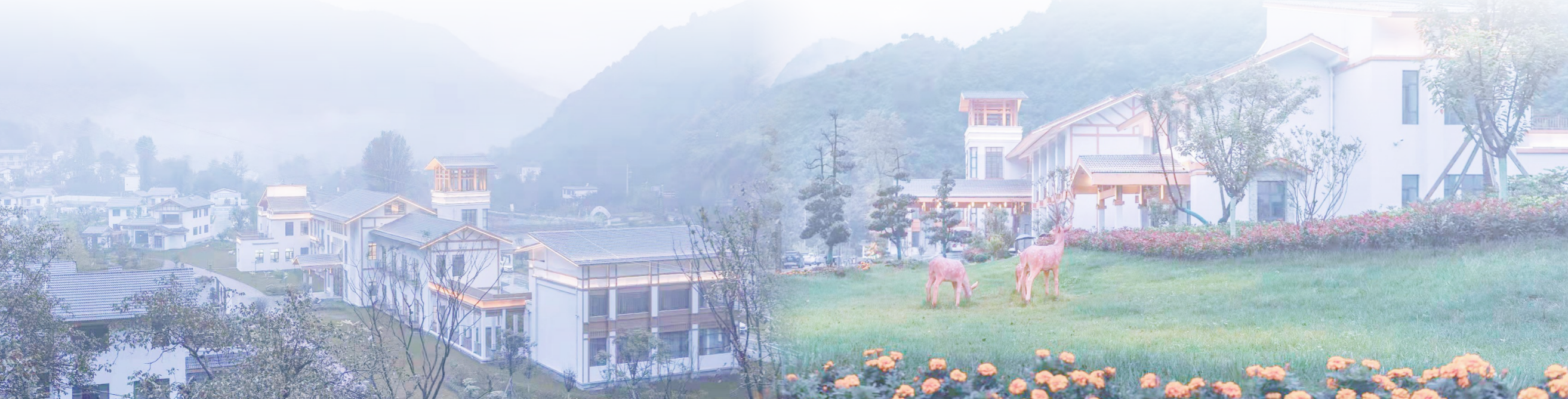
素材来源:中海集团、中建一局、中建三局、中建三局、中建四局、中建五局、中建七局、中建八局、中建新疆建工、中建设计研究院、中建东北院、中建西北院、中建西南院、中建西勘院、中建上海院、中建市政西北院、中建发展、中建安装、中建西部建设

中建集团将继续用心做好乡村振兴工作,充分发挥全产业链优势,帮助补齐基础设施短板,培育壮大特色产业,激发帮扶地区资源禀赋潜力,助力做好“六稳”“六保”工作,在促进实现乡村振兴大局中贡献更多力量。