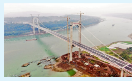
重庆江津白沙长江大桥

宣公弄区域，打造新时代重走“一大路”场景。南广场，商业空间与绿地环绕交错，7个取自嘉兴市传统马家浜文化的玉珏裙楼漂浮之上，形成灵动别致的城市公共空间。同时，火车站将原地面广场车流交织的交通枢纽分散在南北广场地下各处，也将候车大厅、售票厅等主要交通和商业功能收置于地下区域，成为全国首个下沉式火车站。