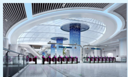
浙江杭州机场快线安装装修项目

大的安装装修工程，社会关注度高、影响力大。面对严峻的工期，必须4个车站同时开工，平行推进，而其中的杭州西站，体量规模相当于3个标准地铁车站。为全力确保工程进度，项目团队发挥连续作战优势，采取24小时不间断施工。春节期间，项目制定抢工专项方案，管理人员100%在岗，组织原计划近两倍的劳务工人科学施工，有力保证项目进度。