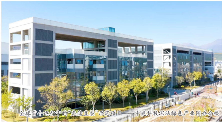
全球首个运行中的“光储直柔”示范项目——中建科技深汕绿色产业园办公楼