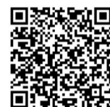
扫码了解详细资讯