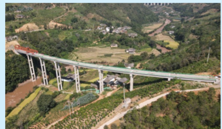
云南华丽高速公路项目

在辽宁大连，由中建北方牵头，中建二局、中建八局、中建交通承建的大连地铁4号线项目历经一年多的建设，目前已进入全面大干阶段。作为城市北部东西向的骨干线，大连4号线途经大连市多个核心功能区。建成后，将为大连市中心城区功能布局、用地、产业布局提供重要支撑，对促进大连经济发展、优化居民出行条件具有重要意义。