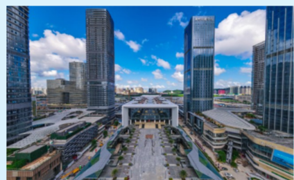
广东横琴口岸及综合交通枢纽开发工程

在重庆，“网红景点”洪崖洞旁，解放碑地下环道三期项目雄伟的洞门屹立在嘉陵江畔，中建监与洪崖洞绚丽的灯光交相辉映。中建八局承建的重庆解放碑地下环道三期项目，由主通道及国泰广场连接道、嘉滨路连接道、还建电力隧道组成。项目作为重庆市、区两级重点基础设施工程，是促进招商引资及方便市民出行的重点民生工程，建成通车后将可缓解重庆市渝中区30%交通压力。目前，项目已完成还建电力隧道结构验收，正式进入移交迁改阶段，为后期主通道顺利实施创造有利条件。