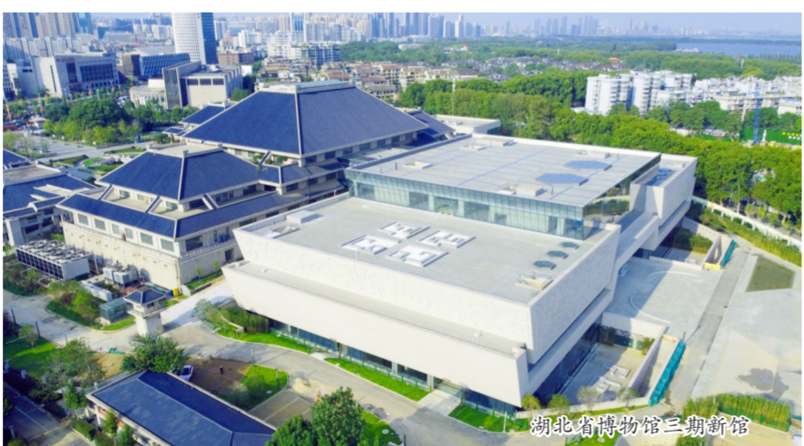
湖北省博物馆三期新馆