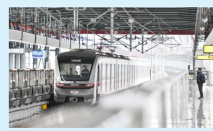
重庆轨道交通9号线一期工程

农历虎年春节前夕，由中建六局投资、建设的重庆江津白沙长江大桥正式建成通车。白沙长江大桥是国务院《长江经济带综合立体交通走廊规划（2014—2020年）》中规划新建的重点过江通道，是重庆市重点基础设施和重大民生工程。项目对促进长江上游乃至国家西部的交通优化，完善长江上游过江通道布局具有重要意义，将与区域既有基础设施项目形成“水公铁”联运优势，助推长江经济带和成渝地区双城经济圈绿色发展。