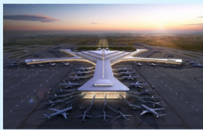
湖南长沙黄花国际机场改扩建工程 T3航站楼项目

在湖南长沙，中建八局牵头、中建五局联合体承建的湖南省最大单体公共建筑——长沙黄花国际机场改扩建工程T3航站楼项目于2月28日正式开工。项目建筑面积53万平方米，建成后形成集高铁、地铁、磁浮、公路等多种交通方式于一体的现代化立体综合交通枢纽，可满足年旅客吞吐量4000万人次。作为国家“十四五”规划交通强国建设工程，项目是全面落实“三高四新”战略定位和使命任务、打造内陆地区改革开放高地，推动长江中下游城市群发展和加快长株潭都市圈建设的关键工程。目前，项目正紧张有序地开展各项工作，助推首个节点顺利完成。